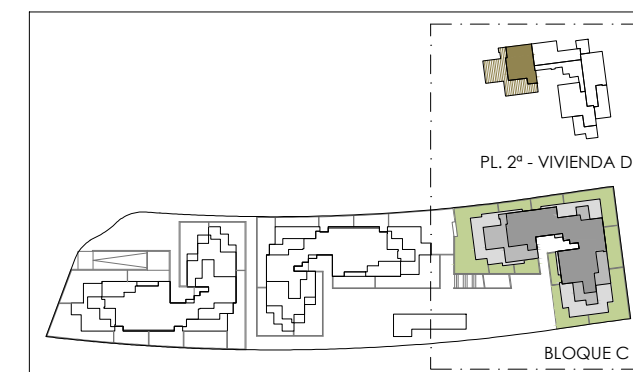
PLANTA DE VIVIENDA INTERIOR