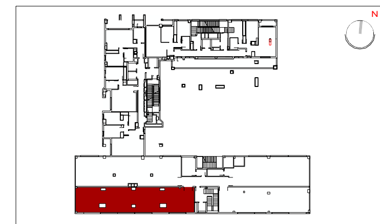
PLANTA 01 LOCAL 06